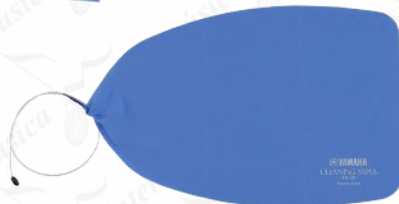
BARÍTONO | EUFONIO